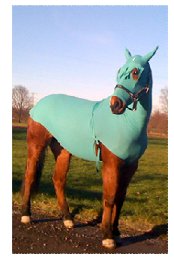
ثوب الخيل غطاء الخيل كساء الساق للخيل